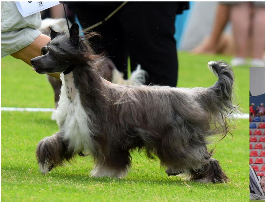
Dark Diamond by Little Jade «Dina» i ringen i Kemi.